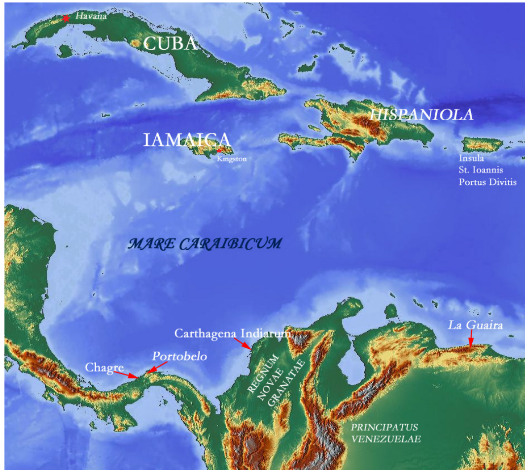
Figura 2: Loca in quae Vernon impetum fecit

Vernon misit parvam classem ad oppugnandam urbem La Guaira putans se posse